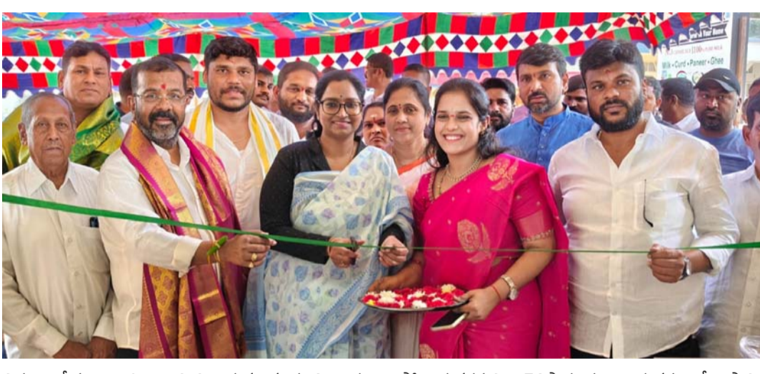
విధంగా సేవలు అందించాలని నిర్మాణాలకు సూచించారు. స్థానిక యువత వ్యాపార రంగంలోకి అడుగుపెట్టి స్వయం ఉపాధి సాధించేందుకు ఇలాంటి ప్రయత్నాలు ప్రోత్సాహకరమని తెలిపారు. ఈ కార్యక్రమంలో స్థానిక ప్రజాప్రతినిధులు, నాయకులు, కాలనీ వాసులు, వ్యాపారవేత్తలు పెద్ద సంఖ్యలో పాల్గొన్నారు.