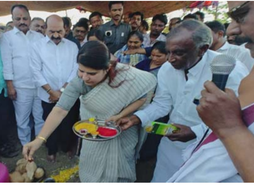
రైతులు, వాటర్ యాజర్ అసోసియేషన్లు ఈ కార్యక్రమంలో చురుకుగా పాల్గొనాలని పిలుపునిచ్చారు. స్థానిక ప్రజాప్రతినిధులు, అధికారులు సమన్వయంతో పనిచేసి భూగర్భ జలాల మట్టాన్ని గణనీయంగా పెంచాలని సూచించారు. ముఖ్యమంత్రి ప్రతిపాదించిన "3 మీటర్లు 8 మీటర్ల కాన్వెన్ట్" ప్రకారం, వర్షాకాలం అనంతరం భూగర్భ జలాల మట్టం 3 మీటర్లకు పైగా ఉండేలా, ఎండకాలంలో 8 మీటర్ల కంటే దిగువకు పడిపోకుండా చర్యలు చేపడతామని తెలిపారు. ప్రతి గ్రామం, మండలం, నియోజకవర్గ స్థాయిలో నీటి ఎద్దడి సమస్యకు శాశ్వత పరిష్కారం కనుగొనడమే ఈ కార్యక్రమం ప్రధాన ఉద్దేశమని కలెక్టర్ స్పష్టం చేశారు.