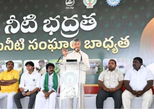
ఉమ్మడి అసంతృప్తం జిల్లా నేడు నీటినిర్వహణ, సంరక్షణ చర్యలతోనే ఉద్ధారం రంగంలో అగ్రగామిగా ఉంది. దీన్ని సూక్ష్మంగా తీసుకుని ప్రజలు, ప్రభుత్వ అధికారులు, సాగునీటి సంపూల కలిసి అడుగిసి రానున్న రోజుల్లో భూగర్భజలాల అంపుతో కార్యాల నిర్వహించాలని విజయవంతం చేశారు.

తాడిపత్రి నియోజకవర్గం నుంచి ప్రారంభించారు. రన్ న్యూస్ తాడిపత్రి అసంతృప్తం జిల్లా ప్రతినిధి రాష్ట్ర వ్యాప్తంగా నీటి భద్రత కోసం చేపట్టిన 100 రోజుల యాక్షన్ ప్లాన్ 'జలధార' కార్యక్రమాన్ని తాడిపత్రి నియోజకవర్గం నుంచి ప్రారంభించాము. చెరువుల పూడికత, కాల్యుమరమ్మతులు, భూగర్భ జలాల పెంపు, నీటి సంరక్షణ ధ్యేయంగా ప్రతి ఎకరాకు నీరు, ప్రతి రైతుకు భరోసా కల్పించేలా జలధార కార్యక్రమాన్ని రూపొందించాం. నీటి సంరక్షణ కోసం ప్రజా ఉద్యమం ప్రారంభించాం. 60 వేల ఎకరాల సాగునీటి సంపూలసభ్యుల సారథ్యంలో జరిగే ఈ కార్యక్రమంలో ప్రతి ఒక్క పౌరుడు భాగస్వామి కావాలి. 2024లో అసంతృప్తం జిల్లాలో 13.36 మీటర్ల లోతులో ఉన్న భూగర్భ జలాలను సమర్థు నీటి నిర్వహణ ద్వారా 2.11 మీటర్ల మేర పెరిగి నేడు 11.25 మీటర్లకు చేరుకున్నాయి. నీరు ఉంటేనే అభివృద్ధి, పరిశ్రమలు, సంక్షేమం-సంపద. ఒకప్పుడు ఎడారిగా మారుతుంది అని అంతా భయపడిన