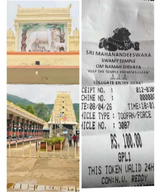
చేయలేదని ప్రస్తుతం అధికవసూలపై చర్యలు తీసుకుంటామని తెలిపారు.

రన్ న్యూస్ మహానంది /సంద్యాల జిల్లా ప్రతినిధి మహానంది పుణ్యక్షేత్రం టోర్లలో నిర్వహణదారులు అక్రమ వసూళ్లకు పాల్పడుతున్నట్లు బుధవారం బయటపడింది. ఎంతో దురంతుండి శ్రీ మహానందిశ్వర కామేశ్వరి అమ్మవారిని దర్శించుకునేందుకు వల రాష్ట్రాల నుండి పెద్ద ఎత్తున భక్తులు మహానంది క్షేత్రానికి వస్తుంటారు. అదే అడుగుగా క్షేత్రంలోని టోర్లలో టెండర్ దారులు వాహనదారుల నుండి అక్రమాలకు పాల్పడుతున్నట్లు తుఫాన్ వాహనానికి 80 రూపాయలు తీసుకోవాలని టెండర్ దారులు 20 రూపాయలు అధికంగా వసూలు చేస్తూ మొత్తం 100 రూపాయలు తీసుకోవడంపై వాహనదారులు టెండర్ దారులపై మండిపడుతున్నారు. టోర్లలో అవరణలో టోర్లలో కూడా 80 రూపాయల రాసి ఉన్నదని, ఇక్కడ మాత్రం 20 రూపాయలు అధికంగా వసూలు చేయడం ఏమిటని భక్తుల ప్రశ్నిస్తున్నారు. ఏది ఏమైనా దేవస్థాన అధికారులు స్పందించి అక్రమ వసూళ్లకు పాల్పడుతున్న టోర్లలో నిర్వాహకులపై చర్యలు తీసుకోవాలని భక్తులు కోరుతున్నారు. అక్రమ వసూళ్లకు పాల్పడితే టెండర్ లైసెన్స్ ను రద్దు చేస్తాం. ఏఈఓ ఎర్రమల మధు. టోర్లలో అక్రమ వసూళ్లపై అయి ఏఈఓ. ను చరవాణి ద్వారా వివరణ కోరగా టోర్లలో చార్జీస్ గతంలో ఎలా ఉన్నాయో అలానే ఉన్నాయని, పెంచడం లాంటివి ఏమి